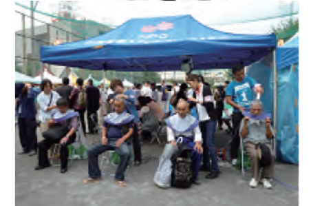
↑ 今年もバリカン部隊が大人気 ↓ でした！

今年も毎年恒例ふるさと夏祭りに参加しました。前日の大雨の中、開催が危ぶまれましたが、当日は雨もなく、例年以上の賑わいとなりました！