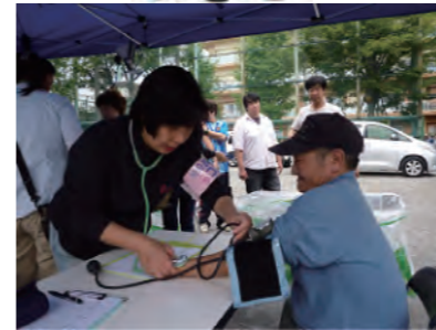
↑ 血圧測定には30名近くの方が並びました ↓ ちょっとひといき～歓談中です