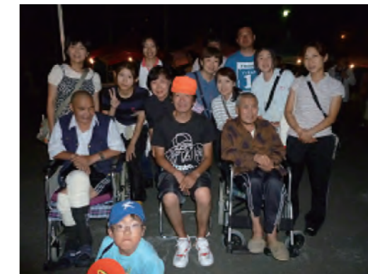
↑ 今年もたくさんのボランティアさんが参加してくれました